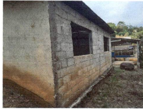
Foto 2: La pared ya esta deteriorada necesita cambiarse por lo defectuosa que se encuentra