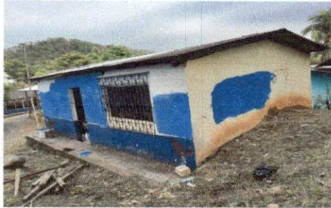
Foto1: EL AULA ESTA MUY PEQUEÑA NECESITAMOS LEVANTARLO PARA TENER UNA MEJOR AMBIENTE